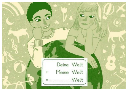
Cover: Deine Welt + Meine Welt = ... Welt

Seit 2015 initiiert die Deutsche Akademie für Kinder- und Jugendliteratur e. V. das Projekt „Ressourcen schonen & Klimaneutral handeln“. Seit 2016 gibt es dank Unterstützung des Umweltbundesamtes sowie des Bundesministeriums für Umwelt, Naturschutz, Bau und Reaktorsicherheit eine Erweiterung um die Einbindung von Welcome-Workshops . Aktueller Anlass ist, Kinder und Familien aus unterschiedlichen Kulturen einander näher zu bringen und mit Hilfe von Büchern Brücken zwischen den unterschiedlichen Lebensformen zu bauen. Auch wenn wir Menschen mit unterschiedlichen Kulturen, Sprachen, Sozialisierungen und Traditionen ausgestattet sind, so leben wir in einer Welt, die wir nur gemeinsam bewahren können.